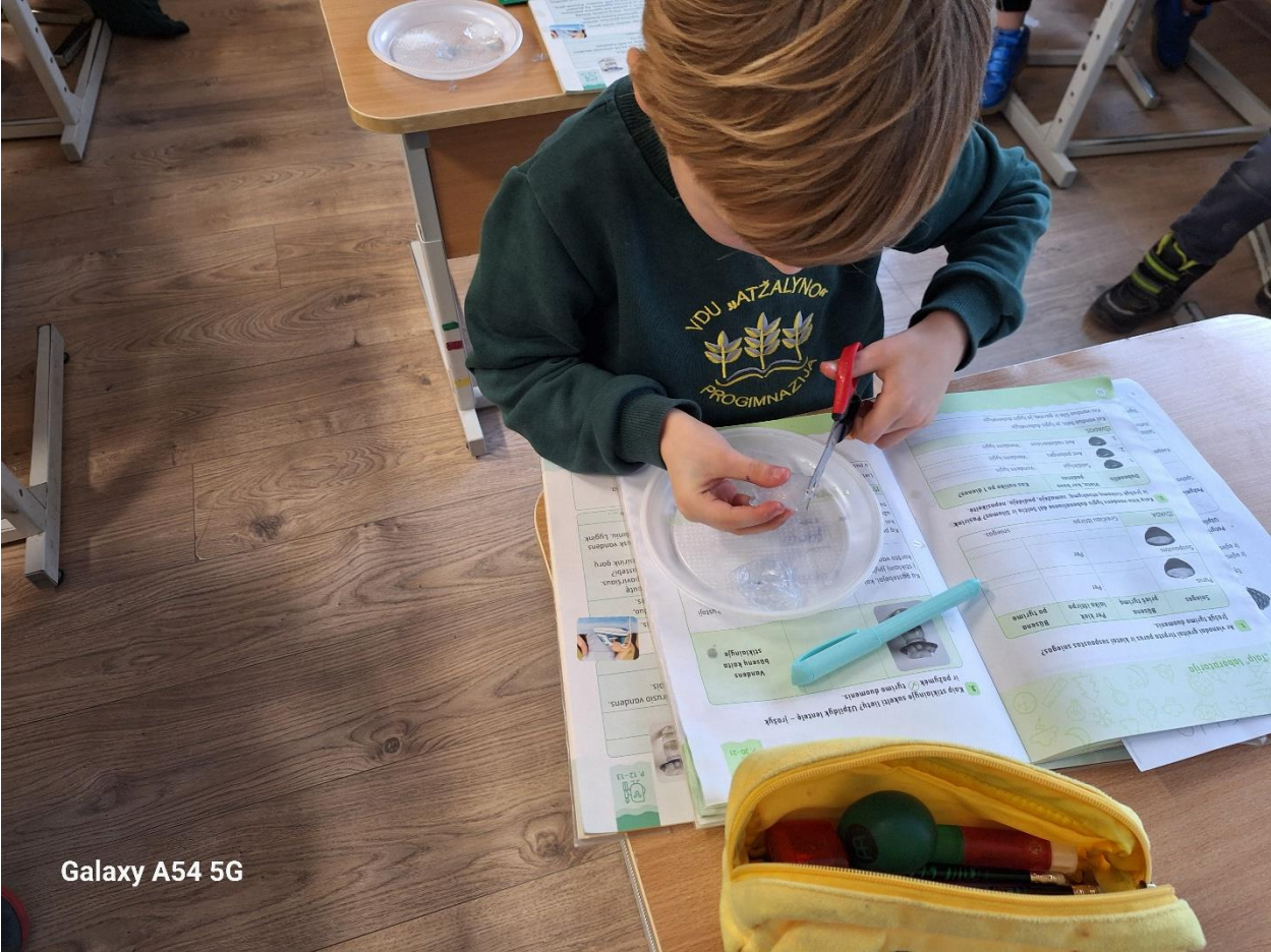
Galaxy A54 5G